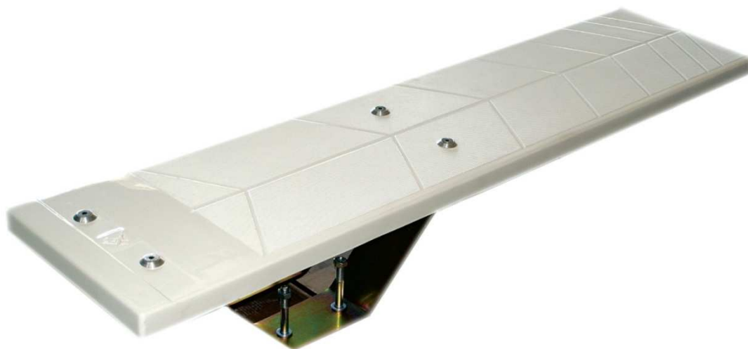
Trampolino in VTR mod. Ulisse cod. 1040505